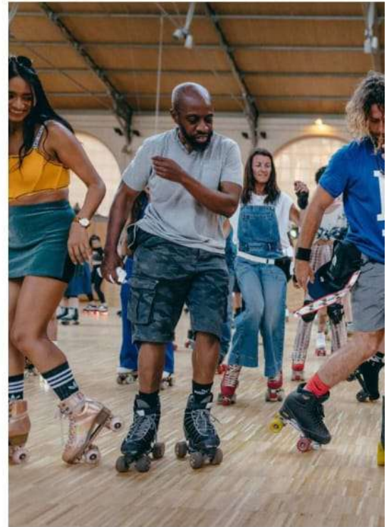
Au Carreau du Temple (Paris, III e ), du 28 juin au 2 juillet, vous pourrez participer à une roller dance party, mais aussi à un discofoot, des majorettes masculines, etc.