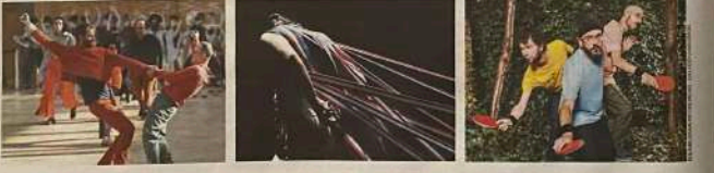
Paris, Seine-Saint-Denis, Île-de-France. Les événements sont répartis dans plusieurs zones géographiques de la région.

5 millions C'est, en euros, le montant engagé par Paris pour les Jeux Olympiques et Paralympiques 2024.